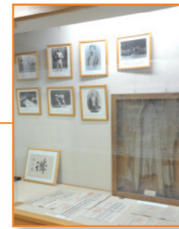
講道館柔道資料館