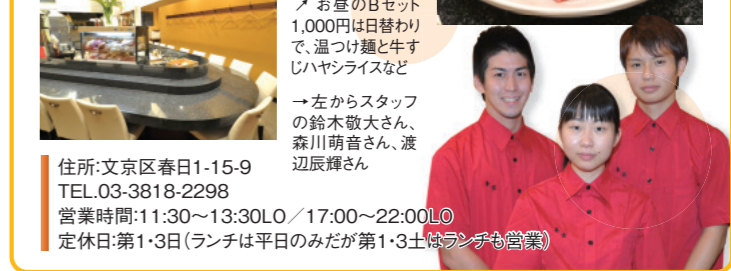
住所:文京区春日1-15-9 TEL.03-3818-2298 営業時間:11:30～13:30LO / 17:00～22:00LO 定休日:第1・3日(ランチは平日のみだが第1・3土はランチも営業)

いま話題の“エイジングビーフ”。こちらでは40日間熟成させ、お肉をやわらかく旨みを増幅させているそう。黒毛和牛を一頭買いしている希少部位も低価格で味わうことができる。さらに、本誌持参の方に生ビールを1杯サービス!(ディナータイムのみ)