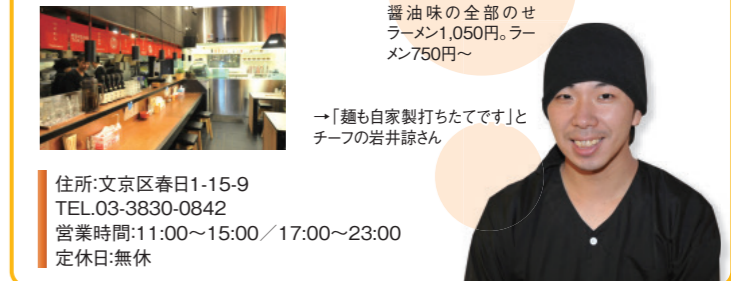
住所:文京区春日1-15-9 TEL.03-3830-0842 営業時間:11:00～15:00 / 17:00～23:00 定休日:無休

常に新しいラーメンを探索する「麺や庄の」が8月にオープンした新店舗。ラムのゲンコツと豚骨を一緒に2日間煮込んだ「ラム豚骨スープ」は、スパイスとの相性も抜群。チャーシューまでラム肉という革新的な1杯になっている。店内奥のラボでは日々新しい味に挑戦中だ。